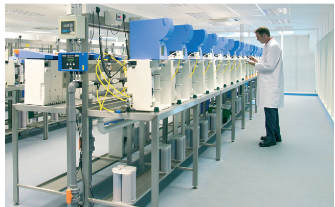
Getestet, getestet und nochmals getestet...

Qualitätsstandards zu entsprechen. Jede Kartusche wird mit höherem Druck als dem Betriebsdruck getestet und anschließend mit ultrareinem Wasser ausgespült, um organische Reinheit (niedriger organischer Gesamtkohlenstoff) zu gewährleisten. Vor dem Verpacken werden sie zum Abschluss mit Stickstoff entleert und versiegelt.