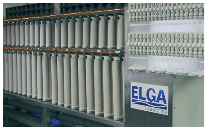
Druckgetestet, mit ultrareinem Wasser gespült und mit Stickstoff entleert

Muster einer jeden Kartuschen-Charge werden sowohl routinemäßig destruktiv als auch für die Ionenleistung getestet.